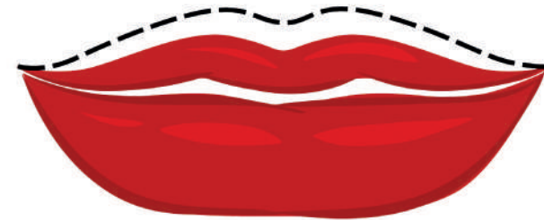
LABIO SUPERIOR PEQUEÑO